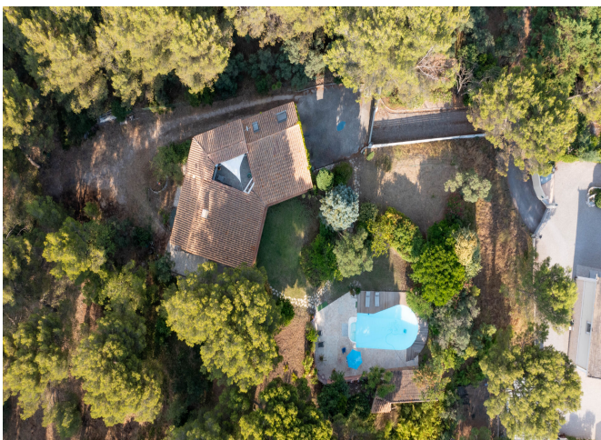
Photo du bien